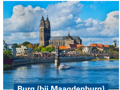
Burg (bij Maagdenburg)

Welkom in Braunschweig! Deze charmante Duitse stad biedt een mix van geschiedenis, cultuur en culinaire verwennerij. Verken de oude binnenstad met haar vele bezienswaardigheden, zoals het imposante Kasteel Dankwarderode met prachtig uitzicht en het Staatstheater in Kasteel Braunschweig. Geniet van gevarieerde gerechten in gezellige cafés, snackbars en restaurants. Voor een romantisch diner is de Burgplatz de ideale plek. Braunschweig is de perfecte bestemming voor een ontspannen en veelzijdige vakantie!