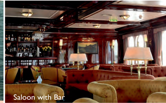
Saloon with Bar