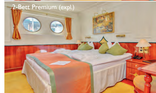
2-Bett Premium (expl.)