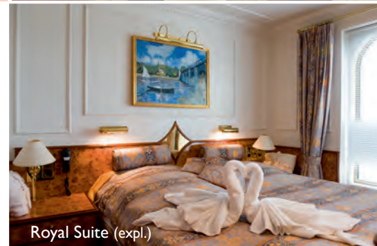
Royal Suite (expl.)

De MS Royal Crown heeft 45 buitenhutten variërend van luxe hutten (13,5 m2) met aparte bedden tot premium hutten (14,5 m2) en de ruime Royal Suites (18,2 m2). Alle suites zijn uitgerust met kasten, een kaptafel, satelliet-tv en radio, een kluisje, individueel regelbare airconditioning en een badkamer met douche / toilet en haardroger. De hutten op het hoofdek hebben patrijspoorten en de Royal Suites op het bovendeck hebben grote ramen.