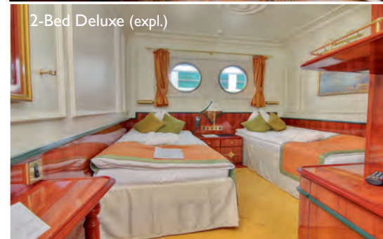
2-Bed Deluxe (expl.)