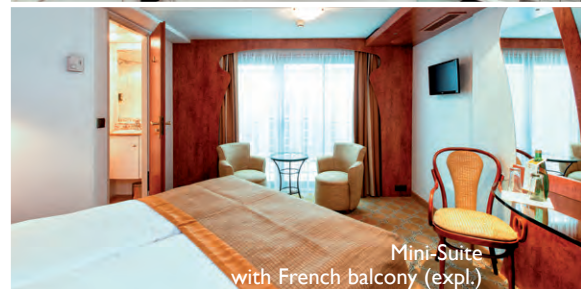
Mini-Suite with French balcony (expl.)