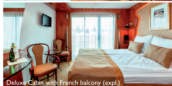
Deluxe Cabin with French balcony (expl.)