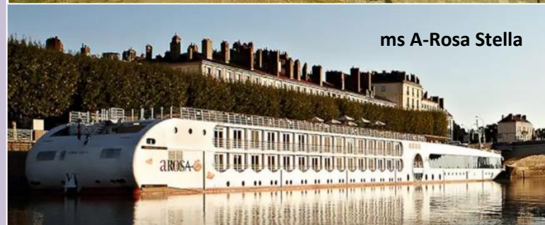
ms A-Rosa Stella